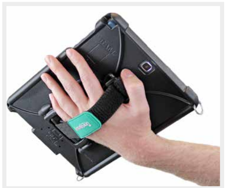
RAM-GDS-HS1U GDS® Hand-Stand™ Tablet Handriem en standaard voor tablets