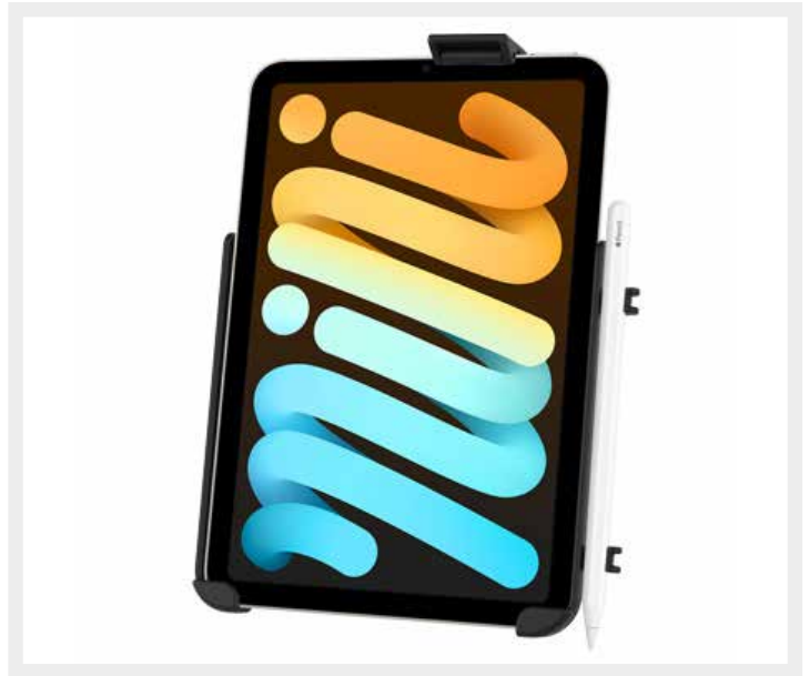
RAM-HOL-AP36U RAM® EZ-Roll'r™ Houder voor Apple iPad mini 6