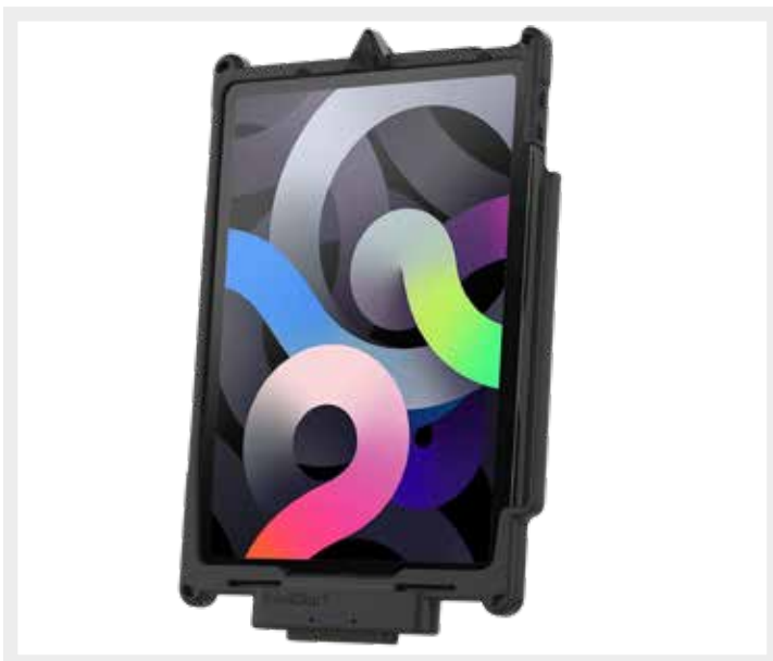
RAM-GDS-SKIN-AP32-NG IntelliSkin® Next Generation beschermhoes voor de Apple iPad Air (4e & 5e generatie) & iPad Pro 11” (1e - 4e generatie)

Het gekozen RAM® montagesysteem bestaat uit de volgende onderdelen: