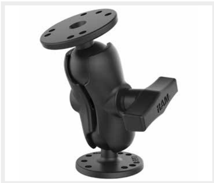
RAM-101U-B C Maat korte dubbele arm en twee ronde basisplaten met universeel AMPS-gatenpatroon