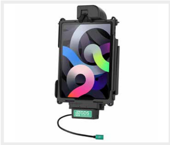
RAM-GDS-DOCK-AP32CPU GDS® Tough-Dock™ voor Apple iPad Air (4e en 5e generatie) & iPad Pro 11" (1e - 4e generatie) in IntelliSkin® Next Gen